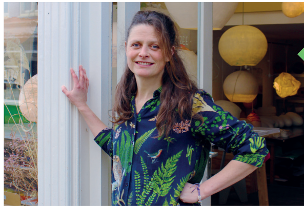
Vilt aan Zee

Zin in koffie, een goed boek, of allebei? Loop een klein stukje terug waar je vandaan kwam en ga linksaf de Hoogstraat in. Nadat je Paleis Noordeinde voorbij bent gelopen, begeef je je op Het Noordeinde. Al vrij snel vind je aan je rechterhand: Bookstor . In dit monumentale pand kun je verdwalen in verhalen. Hier kom je tot rust, drink je een koffie, verricht je wat werk en zoek je achter in de verscholen tuin een sereen plekje en stel je jezelf de vraag: 'wáárom ben ik hier nog niet eerder geweest?' Bookstor is veel meer dan wat de naam doet vermoeden. Er is zelfs een bed and breakfast met twee kamers of zoals de eigenaar omschrijft: 'een fijne plek waar ook een bed in staat'.