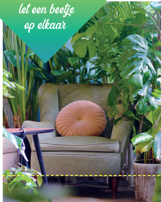
Filya Indoor Garden

Voel je van harte welkom, let een beetje op elkaar