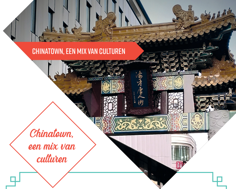
Chinatown, een mix van culturen

We beginnen deze route in de Wagenstraat, in de jaren '20 van de vorige eeuw was deze straat het populaire uitgaansgebied van Den Haag, een straat die in de