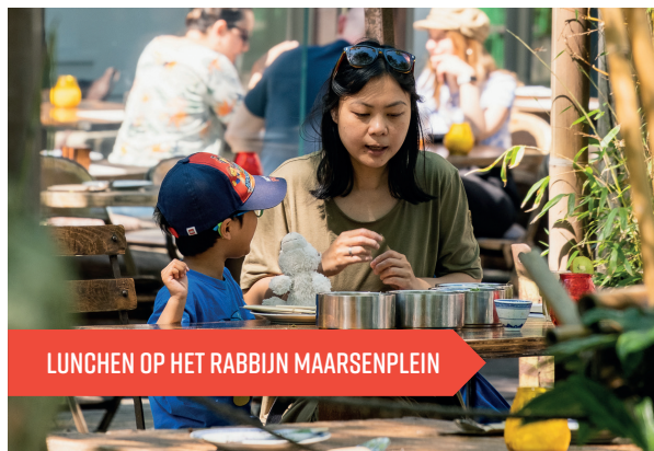
LUNCHEN OP HET RABBIJN MAARSENPLEIN