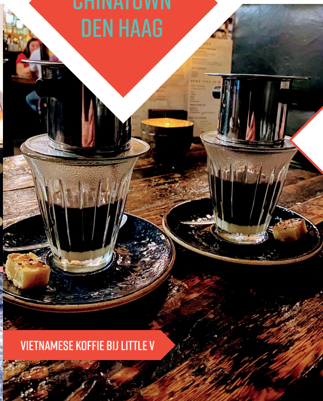
VIETNAMESE KOFFIE BIJ LITTLE V