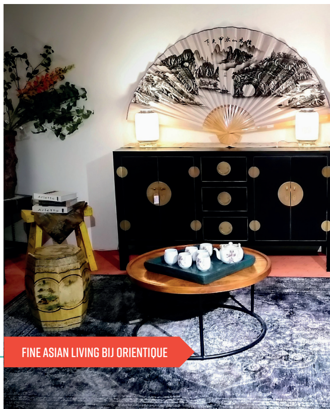
FINE ASIAN LIVING BIJ ORIENTIQUE